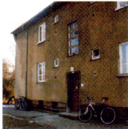
Ein Haus für Jugendliche.

Jetzt hat er seinen Mietvertrag in der Tasche.